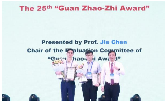
关肇直奖评奖委员会主任陈杰院士为关肇直奖获得者颁奖