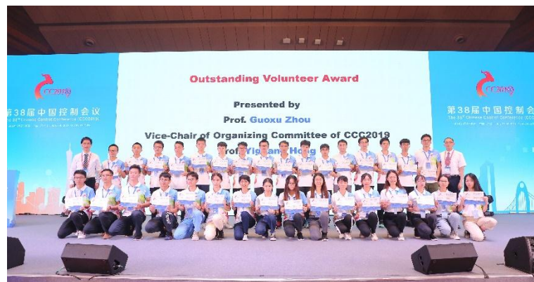
优秀志愿者颁奖仪式

广东工业大学在会议期间组织了三百余名教师和学生志愿者，向参会代表们提供接站、注册、住宿、餐饮、会议咨询等服务。这些教师和身穿白色志愿服的学生活跃在会场、酒店等各个领域，用他们的一腔热情，为参会代表提供及时周到的服务，保证了会议各项工作的顺利进行，赢得了参会代表的认可和肯定。会议授予广东工业大学表现突出 108 名学生“优秀志愿者”荣誉称号。